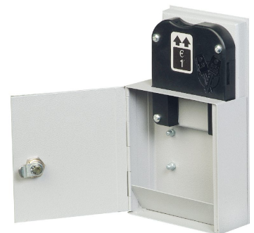
Pfandschloss mit Münzauffangfach abschließbar Art.-Nr. 33015