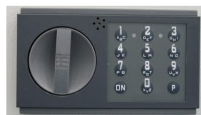
Code-Kombi K 15mm vorstehend Art.-Nr. 33014

Sondermaße und Ausführungen auf Anfrage gg. Mehrpreis lieferbar !