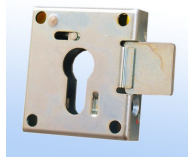
Schlosskasten für Profilhalbzylinder Art.-Nr. 33010

Durch die Vorrüstung mit Schlosskasten für Profilhalbzyl. anstatt Zyl.-Schloss (gg. Aufpreis) können Sie die Möbeleinsatztresore in Ihre bestehende Schließanlage integrieren. Dann nur bauartähnlich Sicherheitsstufe A und S1!