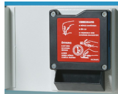
Pfandschloss Art.-Nr. 33012