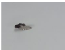
DB-Schloss (standard) flächenbündig