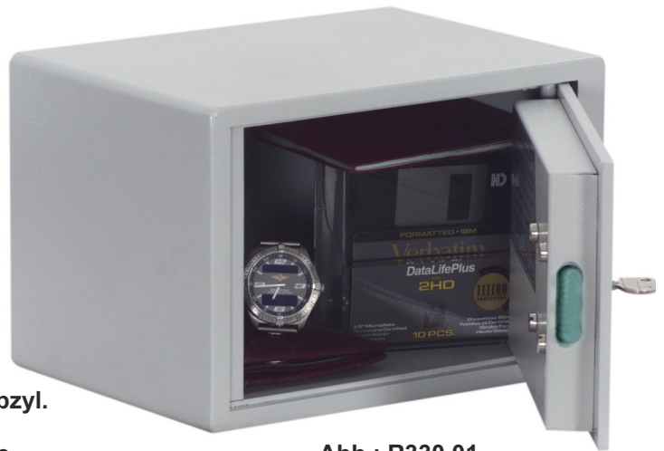
Abb.: R330 01 mit DB-Standschloss

Versicherungsschutz: bis € 1.500,- (bei fachgerechter Montage gem. Bedienungsanleitung) Unverbindliche Richtwerte, sprechen Sie mit Ihrer Versicherung. Korpus, flammgeschützt, einwandig 3 mm stark mit einer doppelwandigen Tür, Türblatt 6 mm stark. Zwei Bohrungen an der Rückwand und eine Bohrung im Boden serienmäßig zur Befestigung vorgesehen. Geeignet zum Einbau in Schreibtische, Küchen, Einbauwänden, Schlafzimmer, Schränken etc.. Verriegelung über DB-Schloss der VdS-Klasse I (inkl. zwei Schlüsseln). Lackierung: RAL 7035 lichtgrau