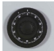
Mech. ZK-Schloss 12mm vorstehend Art.-Nr. 33013