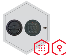
Elektronischeschloss kombiniert mit mechanischer Revision (Ausser Art. 33200-33201)