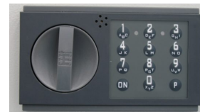
Code-Kombi K 15mm vorstehend Art.-Nr. 34022

Sondermaße und Ausführungen auf Anfrage gg. Mehrpreis lieferbar !