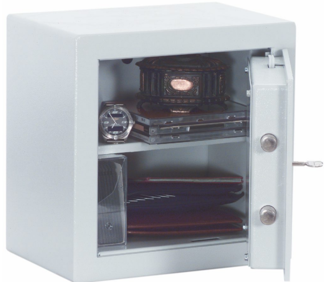
Abb.: R340 02