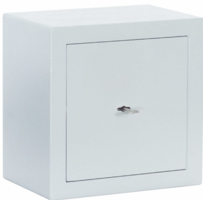
Abb.: R340 02