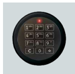
Elektronikschloss Solar Basic