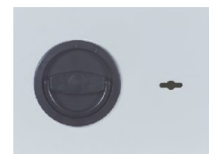
Klappgriff DB Kunst- stoff schwarz (Standard) 12mm vorstehend