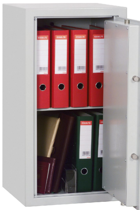
Abb.: R342 05 mit DB-Standardschloss

Auf Wunsch auch mit Elektronikschloss lieferbar (gegen Aufpreis).