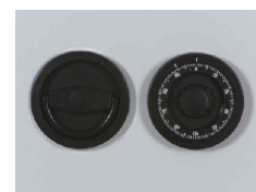
Mech. ZK-Schloss 12mm vorstehend Art. Nr.: 34220