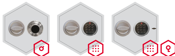
Mechanisches Kombinationsschloss Elektronisches Kombinationsschloss Elektronischschloss kombiniert mit mechanischer Revision