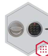
Elektronischeschloss kombiniert mit mechanischer Revision