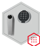
Elektronisches Kombinationsschloss Primor 3000 level 5