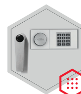
Elektronisches Kombinationsschloss B 30 (Ausser Art. 413100.00)