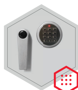
Elektronisches Kombinationsschloss Stellar Business