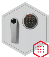
Elektronisches Kombinationsschloss Solar Basic