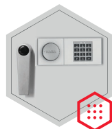
Elektronisches Kombinationsschloss B 30 (Ausser Art. 413100.00)