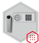
Elektronisches Kombinationsschloss B 30 (Ausser Art. 419100.00)