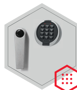
Elektronisches Kombinationsschloss Primor 3000 level 5