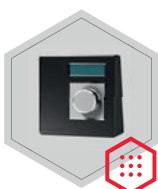
Elektronisches Schloss Paxos Advance set 3+5 v. 01

2 Schlösser 1 DF-Tastatur Gator Signal Box Gator Netzteil Riegel-Sensor Netzteil