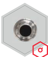
Mechanisches Zahlen- schloss ZK 1947 La Gard C

(1 normaler Schlüssel, 1 Einhahschlüssel)