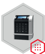
Elektronisches Schloss Gator 8000 + DF v. 01

2 Schlösser 1 DF-Tastatur Gator Signal Box Gator Netzteil Riegel-Sensor Netzteil