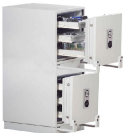
Abb.: R467 02 mit Elektronikschloss Solar und Metallbeschlag verchromt, gg. Aufpreis

S60DIS = 60 Min. zertifizierter Feuerschutz für Daten durch besondere Betonfüllstoffe und spezielle Dichtungen. Erfolgreicher Feuerwiderstands- sowie Feuerstoßtest bis 1090°C und Sturzttest aus 9,15m Fallhöhe.