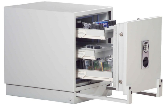
Abb.: R467 01 mit Elektronikschloss Solar und Metallbeschlag verchromt, gg. Aufpreis

Versicherungsschutz: Durch definierte Einbruchprüfung nach VdS 2450/EN 1143-1 Klasse I bei fachgerechter Verankerung gemäß unten aufgeführter Tabelle. Unverbindliche Richtwerte, sprechen Sie mit Ihrer Versicherung. Feuerschutz durch Brandprüfung nach EN 1047-1 Güteklasse S 60 DIS. Zertifiziert und güteüberwacht durch VdS-Zert. in Köln. Korpus und Tür mehrwandig. Tür 151 mm stark, mit allseitiger Bolzenverriegelung. Verriegelung über Doppelbartschloss. (inkl. zwei Schlüsseln) Beschläge 60 mm vorstehend. Verschiedene Ausführungen bringen größtmögliche Nutzung für Datenträger und vieles mehr. Mit Sockel 85 mm H. Serienmäßig 2 Bohrungen Boden. Gegen Mehrpreis auch mit Elektronikschloss anstatt Doppelbartschloss lieferbar. Lackierung: RAL 7035 lichtgrau