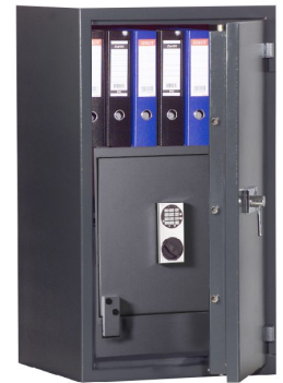
Abb.: R468 03 Elektronikschloss Solar für Haupttür/Innentresor Metallbeschlag verchromt und Sonderlackierung, gg. Aufpreis