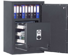
Abb.: R468 02 Elektronikschloss Solar für Innentresor, Metallbeschlag verchromt und Sonderlackierung, gg. Aufpreis