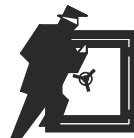
Klasse II EN 1143-1