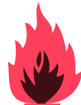
S 60 DIS Innentresor

Schubladen-Maße bei DIS-Innentresor Tiefe 387mm: 75x347x381mm (HxBxT) Tiefe 750mm: 75x347x516mm (HxBxT)