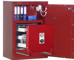
Abb.: R469 02

Elektronikschloss Solar für Innentresor, EMA-Komp., Metallbeschlag verchromt und Sonderlackierung, gg. Aufpreis