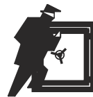
Klasse III EN 1143-1

Elektronikschloss Solar für Innentresor, Metallbeschlag verchromt und Sonderlackierung, gg. Aufpreis