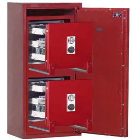
Abb.: R469 04

Elektronikschloss Solar für Innentresor, EMA-Komp., Metallbeschlag verchromt und Sonderlackierung, gg. Aufpreis