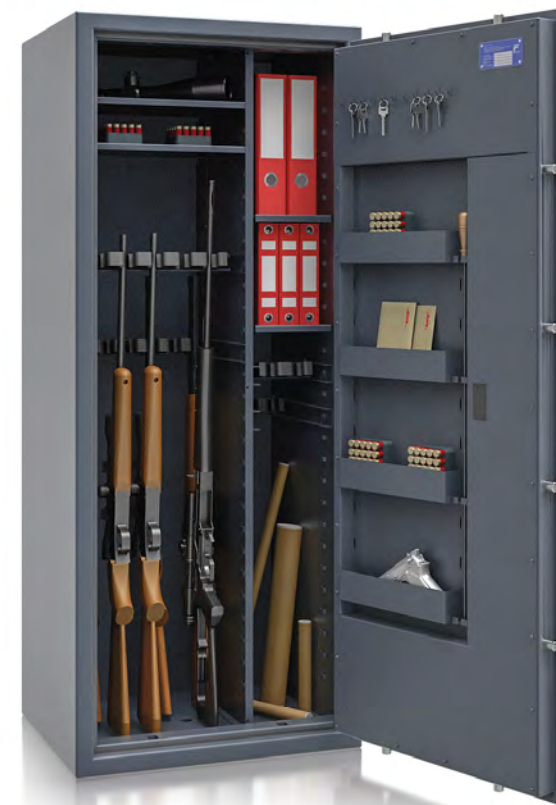
R564 69 Kombi