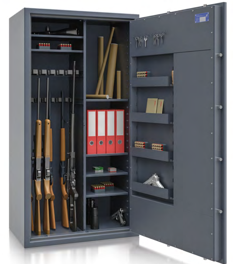
R564 76 Kombi