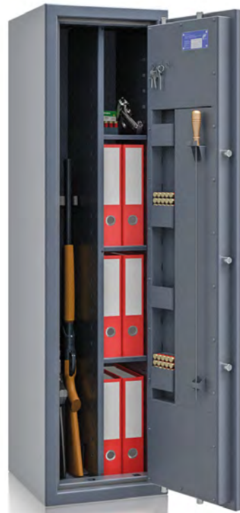
R564 75 Kombi