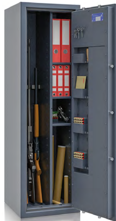
R564 74 Kombi