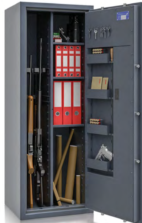
R564 66 Kombi