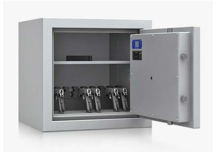
Abb.: Modell R592 01