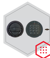
Elektronischeschloss kombiniert mit mechanischer Revision (Ausser Art. 59300)