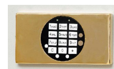
Elektronikschloss mit vergoldetem Beschlag gg. Aufpreis (15 mm vorstehend)